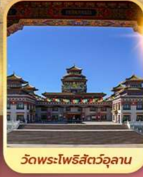
วัดพระโพธิสัตว์อูลาน