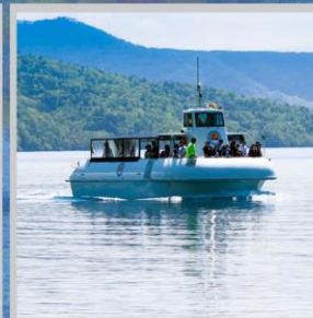
“LAKE SHIKOTSU GLASS BOAT”