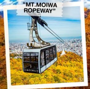
“MT. MOIWA ROPEWAY”