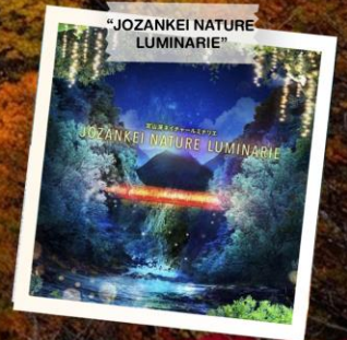
“JOZANKEI NATURE LUMINARIE”

วันเดินทาง 23 - 28 ต.ค. 2569 (วันปืยมหาราช) 28 ต.ค. - 2 พ.ย. 2569 30 ต.ค. - 4 พ.ย. 2569