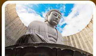
เนินเขาแห่งพระพุทธรเจ้า