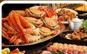
บุฟเฟ่ต์ชาบู+ชาปู 3 ชนิด