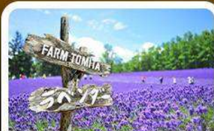
โทมิตะฟาร์ม