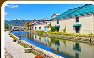
คลองไอตารุ