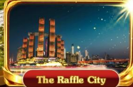
The Raffle City