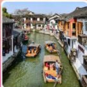
หมู่บ้านโบราณซูเจียเจี๋ย