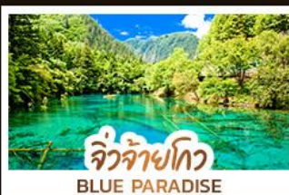
จิวจ้ายโกว BLUE PARADISE