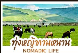
ทุ่งหญ้ากานหนาน NOMADIC LIFE