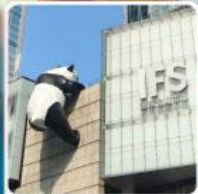
แพนด้ายักษ์ปีนตึกIFS