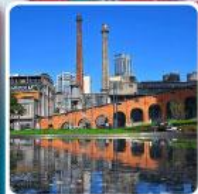
Eastern Suburb Memory Chengdu