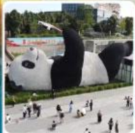
รูปปั้นแพนด้าเซลฟี