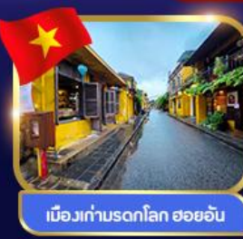
เมืองเก่ามรดกโลก ฮอยอัน