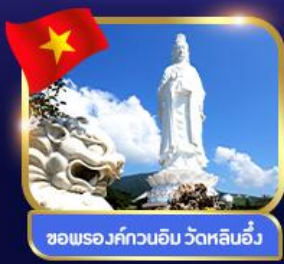
ชมพระอภิวัดหินอิม วัดหลินอึ้ง