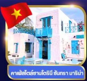
คาเฟ่สไตล์ซานโตรินี ชันตรา มารีน่า