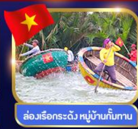
ล่องเรือกระดิว หมู่บ้านกัมบาน