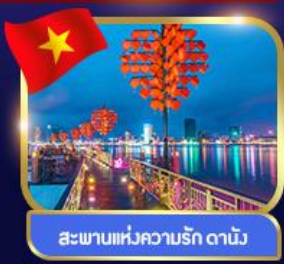
สะพานแห่งความรัก ดานัง