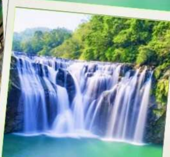
น้ำตกสีเฟิน