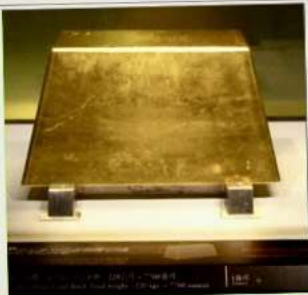
พิพิธภัณฑ์ทองคำ