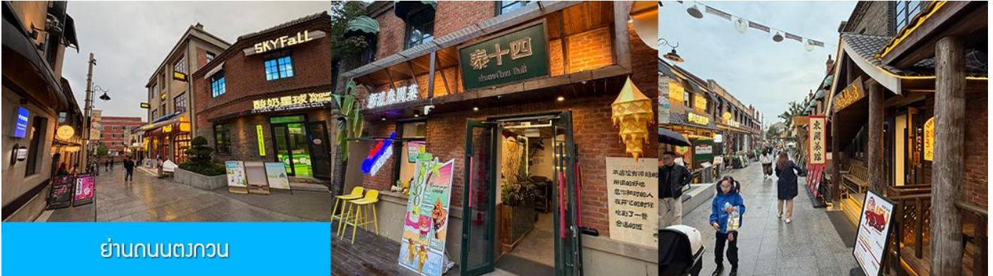
ย่านถนนตวงกวน

หลังอาหารนำท่านเที่ยวชม จัตุรัสชิงไห่ 星海广场 เป็นจัตุรัสขนาดใหญ่เป็นแลนด์มาร์คสำคัญของเมืองต้าเหลียน สร้างขึ้นเพื่อเฉลิมฉลองในโอกาสที่รัฐบาลอังกฤษคืนเกาะฮ่องกงในให้จีนในปี ค.ศ. 1997 ตั้งอยู่ชายฝั่งทะเลในเมืองต้าเหลียน เป็นจัตุรัสใจกลางเมืองที่ใหญ่ที่สุดในโลกและ เป็นแลนด์มาร์คของเมืองต้าเหลียน รายล้อมด้วยตึกระฟ้าที่ทันสมัย ภายในมีบ่อน้ำพุดนตรี ลานหญ้าขนาดใหญ่ และลานกว้างสำหรับจัดกิจกรรมกลางแจ้ง อาทิ เทศกาลเบียร์นานาชาติ การแข่งขันวิ่งมาราธอน งานแฟชั่นนานาชาติเมืองต้าเหลียน ฯลฯ