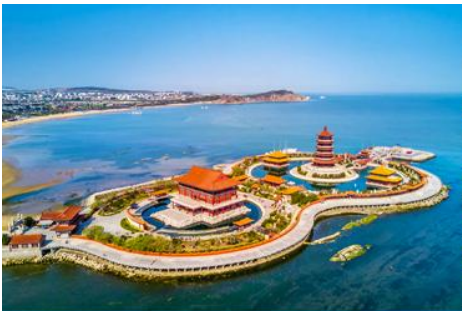
อุทยานท่องเที่ยวแปดเซียนข้ามทะเล