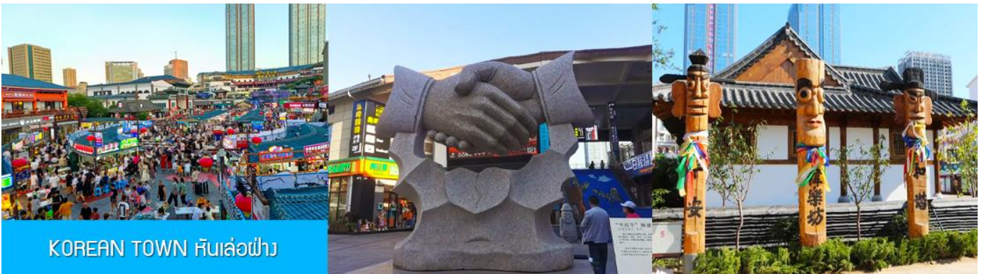
KOREAN TOWN หันเล่อฝาง