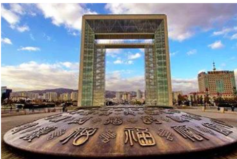
ประตูแห่งโชคกลาง