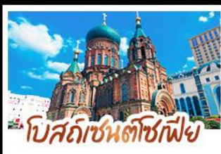
โบสถ์อัสสัมชัญ เมืองฮาร์บิน