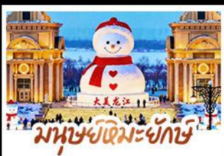
มนุษย์หิมะยักษ์ เมืองฮาร์บิน