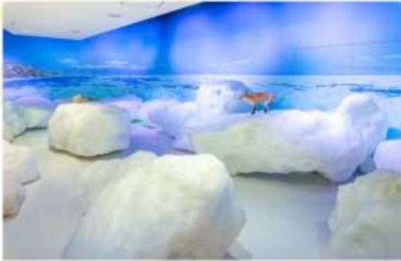
OKHOTSK RYUHYO MUSEUM