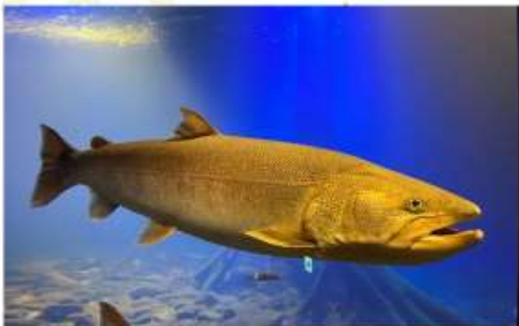
NORTHERN DAICHI AQUARIUM

เปิดโลกใต้ผืนน้ำทางเหนือที่ "พิพิธภัณฑ์สัตว์น้ำคิตะโนะไดจิ" อควาเรียมสุดล้ำที่ออกแบบมาเพื่อจำลองระบบนิเวศของแม่น้ำในฮอกไกโดได้อย่างสมจริงที่สุด ไฮไลท์สำคัญคือการชม "ปลาโอโตะ" ปลาน้ำจืดขนาดยักษ์ในตำนานที่หาชมยาก และคู่กระจกที่ออกแบบพิเศษให้เห็นปลากระโดดทวนน้ำท่ามกลางบรรยากาศป่าไม้ที่สวยงาม