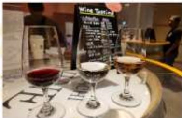
IKEDA WINE CASTLE