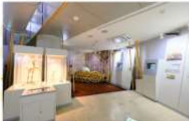
AKAN INTERNATIONAL CRANE CENTER