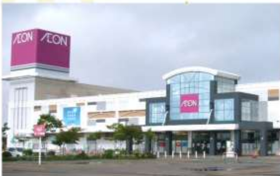
SHOPPING AT AEON MALL KUSHIRO SHOWA