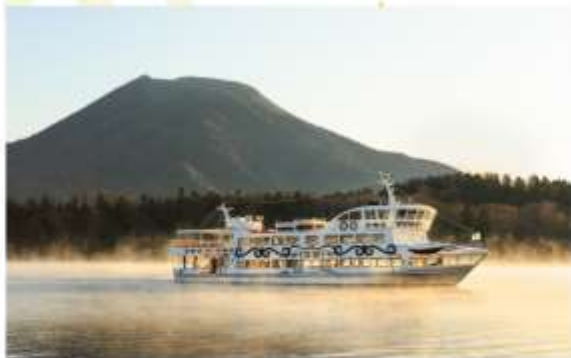
AKAN SIGHTSEEING CRUISE