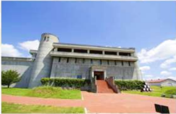
IKEDA WINE CASTLE