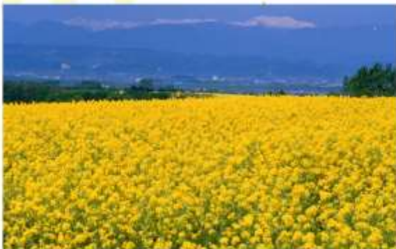
TAKIKAWA NANOHANA FESTIVAL รับประทานอาหารค่ำ ณ กิตตาคาร

อิสระอาหารกลางวัน ภายในหมู่บ้านรามอนอาซาฮิยาม่า (รับเงินคืนจากบัตรเครดิต ค่าเช่า: 3,000 เยน)