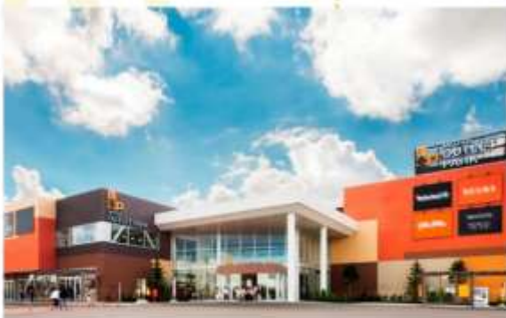
SHOPPING AT KITA HIROSHIMA OUTLET

อิสระอาหารค่ำตามอัธยาศัย (ไม่รวมในรายการ)