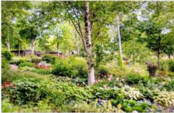
DAISETSU MORI NO GARDEN