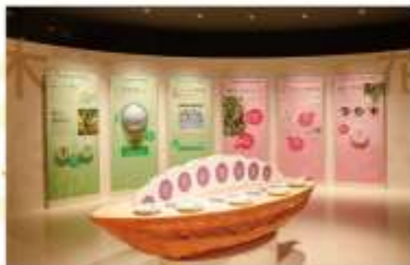
ROYCE CACAO & CHOCOLATE TOWN