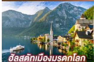
อัลสติกเมืองมรดกโลก