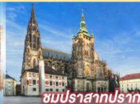
ชมปราสาทปราท