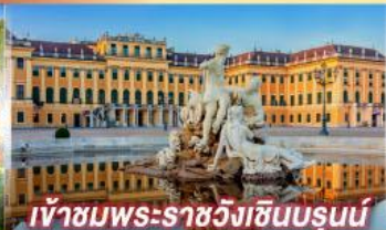
เข้าชมพระราชวังฮินบรุนน์