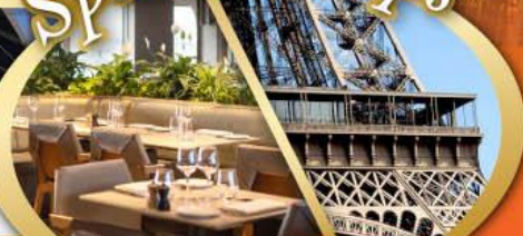
รับประทานอาหารกลางวัน บนหอไอเฟล

ไฮไลท์ในโปรแกรม • สะพานไมชาเปเล ลูเซิร์น