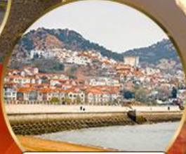
ซาร์จื่อซ่า