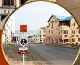
ถนนอ่าวจีปา