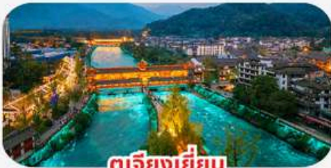
ตุเจียงเยียน