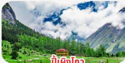
ปีเผิงโกว