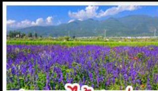
สวนดอกไม้ฮาวู๋ฉ่าง