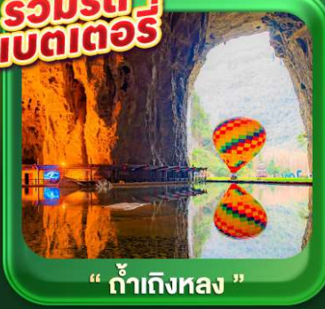
“ ถ้าถึงหลง ”