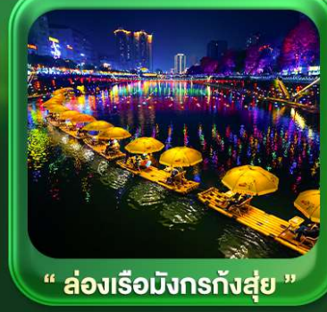
“ ล่องเรือมังกรกังส่วย ”

T2G-CKG32HU ฉงชิ่ง เอ็นจือ...ถ้าถึงหลง ล่องเรือมังกรกังส่วย ผิงซานแกรนด์แคนยอน 5D 4N (HU)