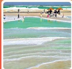
ทะเลสาบเกลือจาเอ้อหาน

ไฮไลท์! กำแพงเกาหลู กำพุทธรศิลป์โบราณ มรดกโลก UNESCO ภูเขาสายรุ้งจางเย่ ภูเขาหินสีสั่นแปลกตา หนึ่งในภูมิประเทศที่แปลกที่สุดในโลก