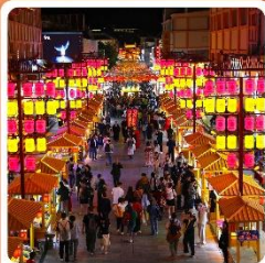
ตลาดกลางคีนซาโจว