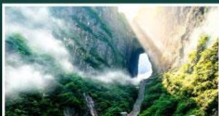
เขาประตูล้ำวรด