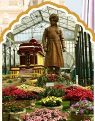
บังกาลอร์