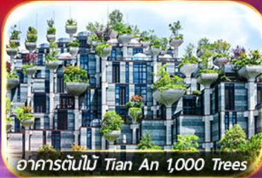
อาคารต้นไม้ Tian An 1,000 Trees