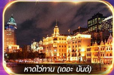
หาดว่อกาน (เดอะ บันด์)

เที่ยวดิสนีย์แลนด์เต็มวัน (รวมรถรับ-ส่ง)