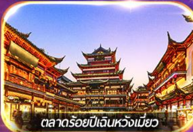
ตลาดร้อยปีเงินหวงเหมียว