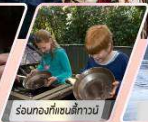
ร้อนท้องที่แซนดี้ทาวน์