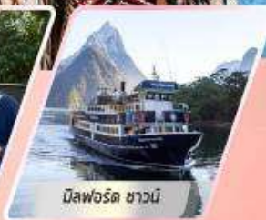
มิสฟอร์ด ซาวน์