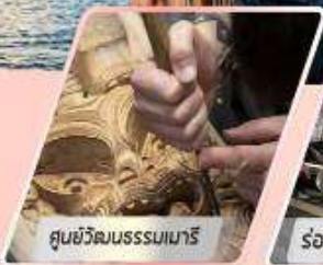
ศูนย์วัฒนธรรมเมารี

เที่ยวเกาะใต้ และเกาะเหนือ : 12 วัน 10 คืน