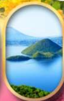
วิวทะเลสาบโทโยะ