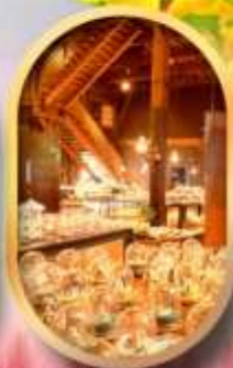
พิพิธภัณฑ์ถ้ำถ่านหิน