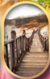
หุบเขาจิกุกาชิ