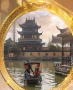
หมู่บ้านโบราณจูเจียเจียว

บินหรู Full service พัก 5 ดาวย่านช้อปปิ้ง