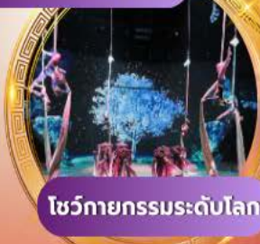
โชว์กายกรรมระดับโลก