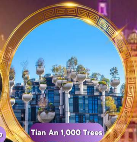
Tian An 1,000 Trees