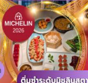
ติ่มซำระดับมิชลินสตาร์

สัมผัสทัศนียภาพเซี่ยงไฮ้ เช็กอินแลนด์มาร์คล้ำยุค ล่องเรือเมืองเก่าจูเจียเจียว พักหรู 5 ดาว ครบจบในทริปเดียว