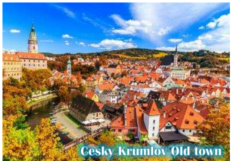
Cesky Krumlov Old town

บ่าย นำท่านเดินทางสู่ “เมืองเชสกี้ คุมลอฟ (เมืองมรดกโลก)” เป็นเมืองขนาดเล็กในภูมิภาคโบฮีเมียใต้ของ สาธารณรัฐเช็กมีชื่อเสียงจากสถาปัตยกรรม และศิลปะของเขตเมืองเก่าและปราสาทครุ มลอฟ ที่ยังคงมีเสน่ห์เหมือนอยู่ในเทพนิยายมา จนถึงทุกวันนี้ และน่าจะเป็นเมืองที่สวยงามที่สุดใน สาธารณรัฐเช็ก, เชสกี้ คุมลอฟได้รับการจัด อันดับให้อยู่ในสิบเมืองที่สวยงามที่สุดในโลก เป็น หนึ่งในสถานที่ที่สวยงามที่สุดและไม่ควรพลาด ในการเดินทางไปสาธารณรัฐเช็ก เดินเล่นไปบน ถนนในยุคกลาง ปราสาทสไตล์บาโรกที่ไม่บุบ สลาย และแม่น้ำที่คดเคี้ยว เมืองเก่าที่งดงามแห่งนี้ได้รับการอนุรักษ์ไว้อย่างดีจากอดีตและการทิ้งระเบิดใน สงครามโลกครั้งที่ 2 ทั้งหมดทำให้เมืองที่มีทิวทัศน์แห่งนี้รู้สึกเหมือนอยู่ในเทพนิยายจากยุคกลางสู่ความเป็นจริง