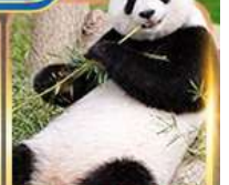
สวนสัตว์จงชิ่ง