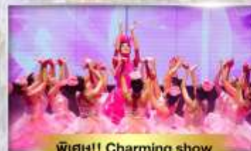
พิเศษ!! Charming show