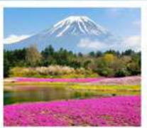
ทะเลสาบโมโตสุ ทุ่งพืชมอส