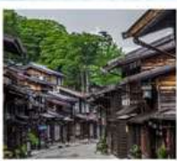
หมู่บ้านโบราณนารายิ จุกุ