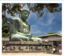
วัดโคโตคุอิน

SHIRAKAWAGO JAPAN ALPS MATSUMOTO KAMIKOCHI FUJI KAMAKURA