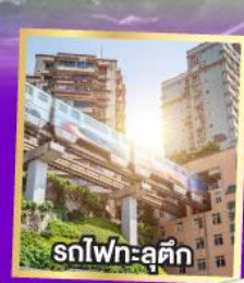
รถไฟฟ้าสุดคึก