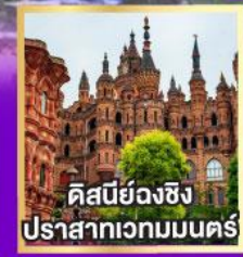
ดิสเนย์วงฉิ่ง ปราสาทเวทมนตร์