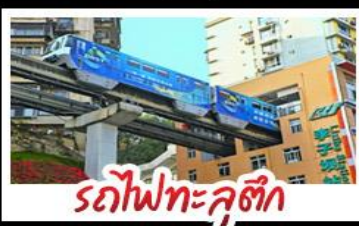
รถไฟทะลุตึก