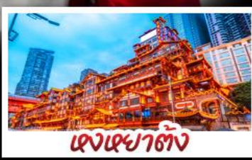
เจงเฉาตัง