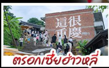
ตรอกเซี่ยฮ่าวหลี่