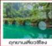
อุทยานเสี่ยวซีหลง