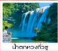
น้ำตกหวงทิวซู