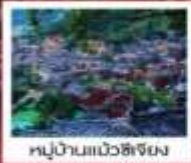
หมู่บ้านแม่วชิเจียง