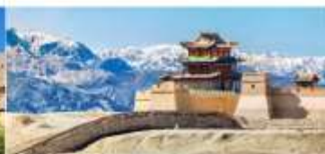
กำแพงเมืองจีน ด่านเจียอวี๋กวน

*ทางบริษัทฯ ขอสงวนสิทธิ์ในการสลับโปรแกรมทัวร์ตามความเหมาะสมขึ้นอยู่กับสถานการณ์หน่วยงาน โดยคำนึงถึงผลประโยชน์ของลูกค้าเป็นสำคัญ