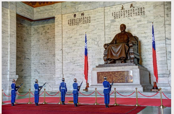
อนุสรณ์สถานเจียงไคเช็ค (Chiang Kai-Shek Memorial Hall)

จากนั้นนำท่านถ่ายรูปกับ ตึกไทเป 101 (Taipei 101) ตึกระฟ้าที่สูงที่สุดในไต้หวัน และเคยเป็นตึกที่สูงที่สุดในโลกในปี ค.ศ. 2004 ความสูงจากพื้นดิน 509.2 เมตร มีทั้งหมด 101 ชั้น ชั้น 1-5 จะเป็น ส่วนของห้องสรรพสินค้าและร้านอาหารต่างๆ โดยมีสินค้ามากมายให้ท่านเลือกซื้อป ทั้งสินค้าทั่วไป