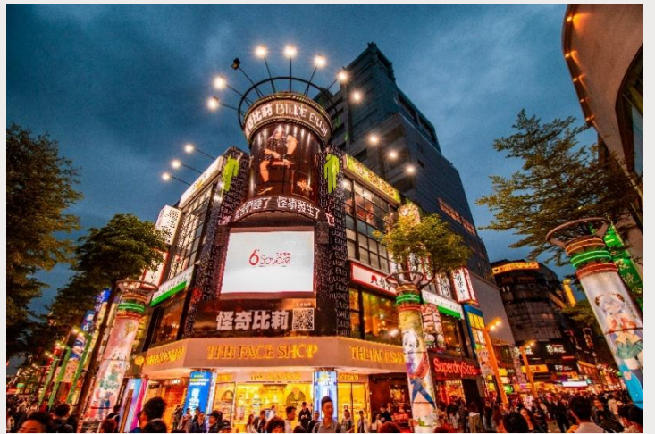
ตลาดกลางคืนซีเหมินติง (Ximending Night Market)

เย็น อิสระอาหารเย็นตามอัธยาศัย ณ ตลาดกลางคืนซีเหมินติง