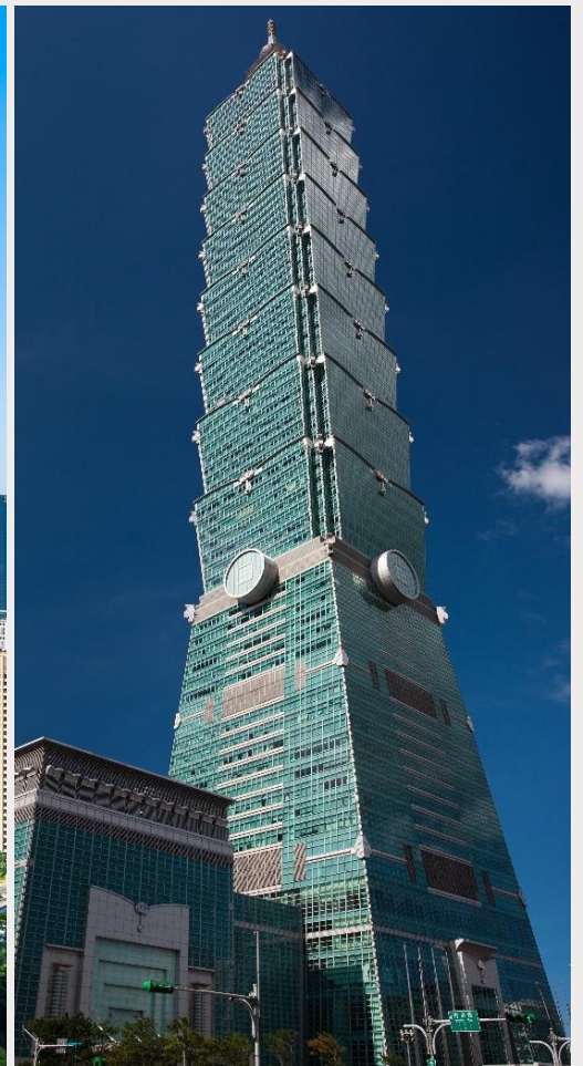
ตึกไทเป 101 (Taipei 101)