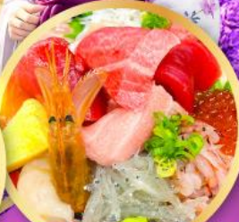
ตลาดปลาฮิมิสึ คาชิโมะจิ

ถ่ายรูปเชคอินวิวฟูจิ กับซุ้มประตูโทเซคิจิ แชนมอน อิสระท่องเที่ยว ซอปปิงหนึ่งวันเต็มในโตเกียว