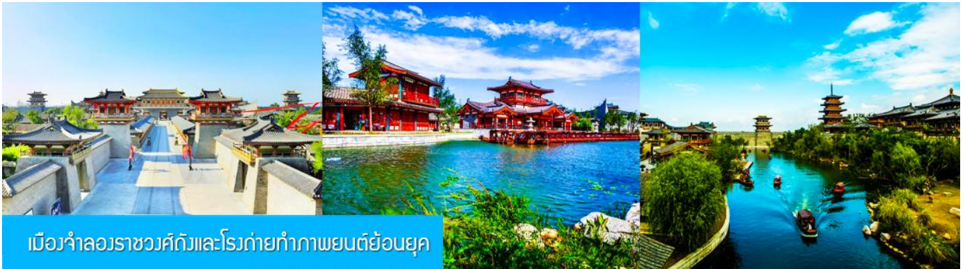
เมืองจำลองราชวงศ์ถังและโรงถ่ายทำภาพยนตร์ย้อนยุค