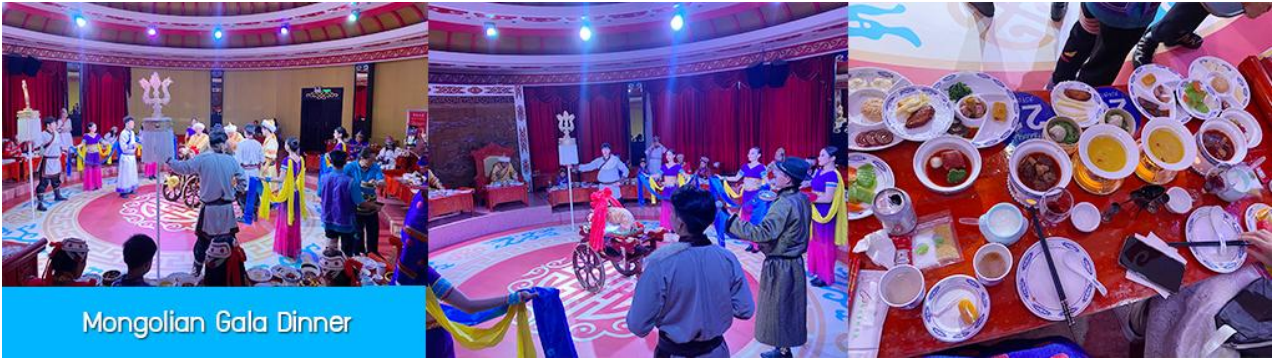
Mongolian Gala Dinner