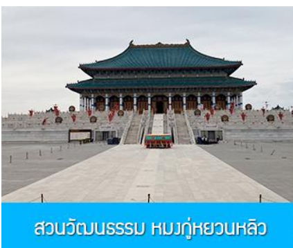
สวนวัฒนธรรม หมงกู่หยวนหลิว

หลังอาหารนำท่าน เที่ยวชม จวนอ๋องจวินหวัง 郡王府 จวนแห่งนี้เริ่มสร้างขึ้นในปี ค.ศ. 1902 สร้างเสร็จในปี ค.ศ. 1936 เป็นที่พำนักของ อ๋องอิฉิจวินหวัง 伊旗郡王 เป็นจวนอ๋องเพียงหนึ่งเดียวที่ได้รับการอนุรักษ์ในสภาพที่สมบูรณ์ โครงสร้างทำด้วยอิฐ หิน และไม้ ประกอบด้วยห้องพัก 16 ห้อง เป็นสถาปัตยกรรมผสมแบบมองโกล ทิเบต และฮั่น