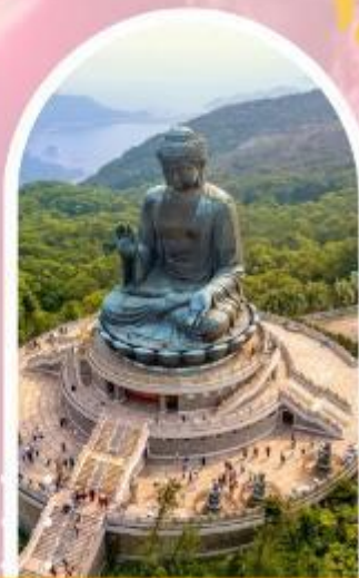
นั่งกระเช้ามองปิง นมัสการพระใหญ่โปวหลิน