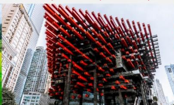
ตึกตะเกียบ