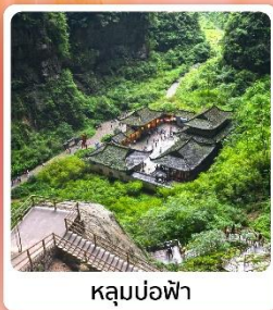
หลุมบ่อฟ้า