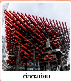
ตึกตะเกียบ