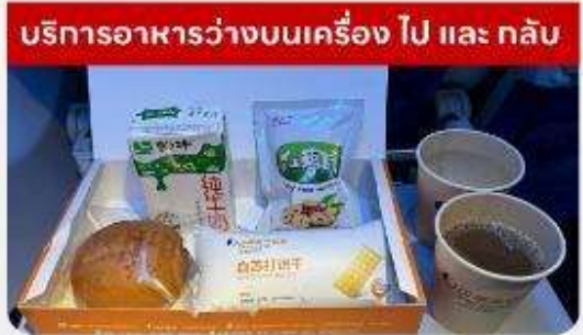
บริการอาหารว่างบนเครื่อง ไป และ กลับ