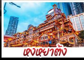
แสงเขย่าตึก