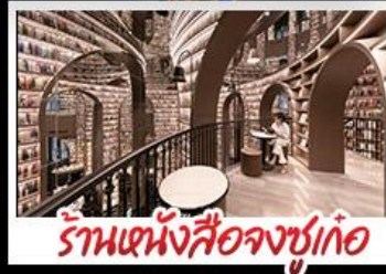
ร้านหนังสือจุงชู่เก้อ