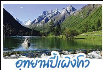
อุทยานปี่เผิงโกว

ภูเขาสึ่ดรุณี อุทยานจิวจ้ายโกว นั่งรถไฟความเร็วสูง น้ำพุไม่ไผ่ตักSKP อุทยานปี่เผิงโกว วัดต้าฉือ ถนนโบราณชอยกว้างชอยแคบ ช้อปปิ้งถนนไถ่กู่หลี่ + ถนนชุนชี่ลู่