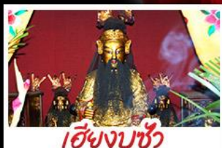
เฮียงบูชิว