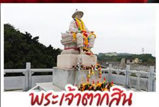
พระเจ้าตากสิน