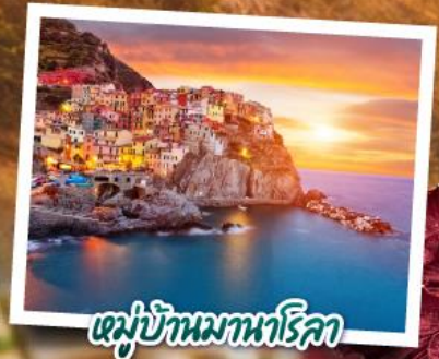
หมู่บ้านมานาโรคา