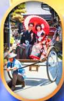
ศาลเจ้าจิ้งจอก