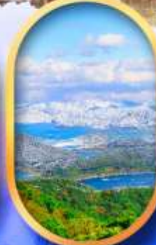
ทะเลสาบมิกะตะ