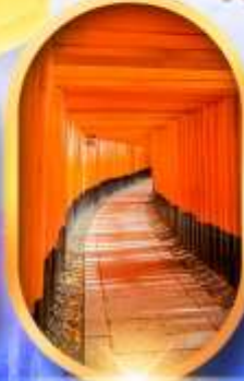
เมืองเก่าทาคายาม่า