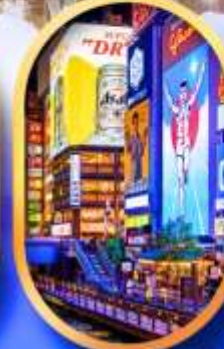
ย่านชิบะฮาชิจิ