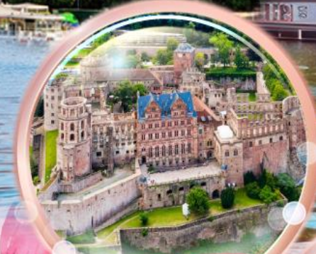
ปราสาทไฮเดิลเบิร์ก