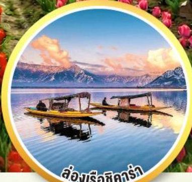
ล่องเรือชิคร่า