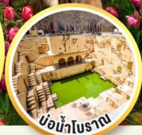
บ่อน้ำโบราณ