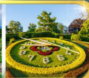
นาฬิกาดอกไม้เมืองเจนีวา