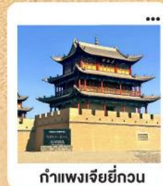
ต้าแพงเจียยี่กวน