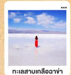
ทะเลสาบเกลือฉาซ่า